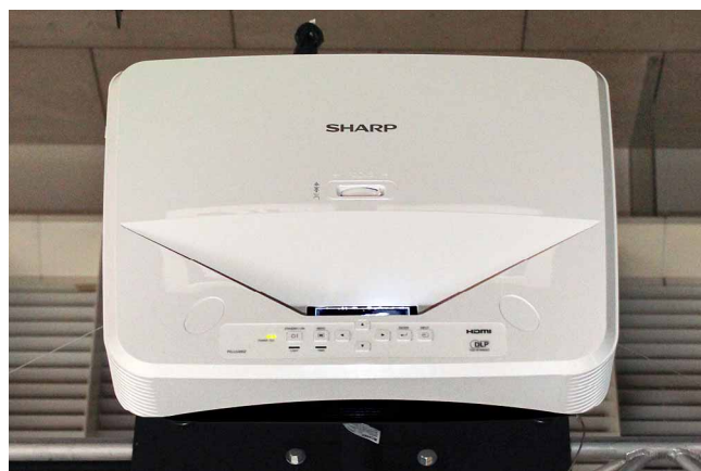
天井設置したレーザー超短焦点プロジェクター<PG-LU400Z>